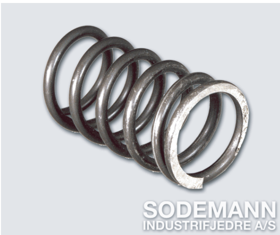
3. Päätelty ja hiottu